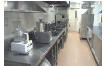
厨房（手作りの食事）